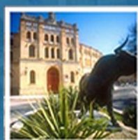
Real Plaza de Toros Plaza de Elias Ahuja Tfno: 956 861 188