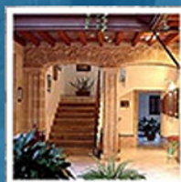
Casa de los Leones C/ La Placilla, 2 Tfno: 956 875 277