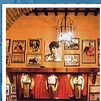
Museo Taurino Galloso C/ Pozos Dulces, 18 Tfno: 956 541 812-675 664 803