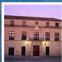
Casa Palacio de Aranibar Plaza del Castillo, 9 Tfno: 956 483 715