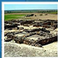
Yacimiento Arqueológico Doña Blanca Ctra. del Portal Tfno: 856 105 058