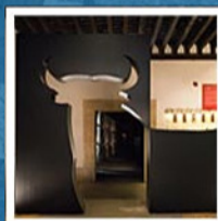
Toro Gallery (Osborne) Bodegas Osborne (Los Moros, 7) Tfno: 956 869 100