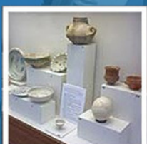
Museo Municipal (Sede Hospitalito) C/ Ganado, 58 Tfno: 956 858 313