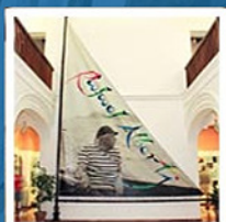
Fundación Rafael Alberti C/ Santo Domingo, 25 Tfno: 956 850 711