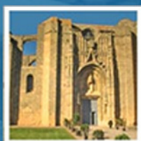
Monasterio de la Victoria Explanada de la Estación, s/n Tfno: