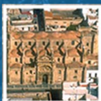
Basílica Menor Ntra. Sra de los Milagros Plaza de España, s/n Tfno: 956 871 716