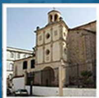
Iglesia de San Francisco C/ San Francisco, 27 Tfno: 956 850 961