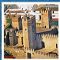
Castillo de San Marcos Plaza del Castillo, 9 Tfno reserva: 627 569 335