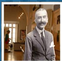
Fundación Pedro Muñoz Seca Plaza del Ave María - Edf. San Luis Tfno: 956 851 731